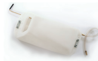
Kit de réservoir de solution