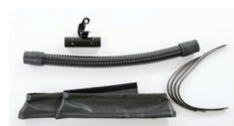
Kit de rétention de poussière